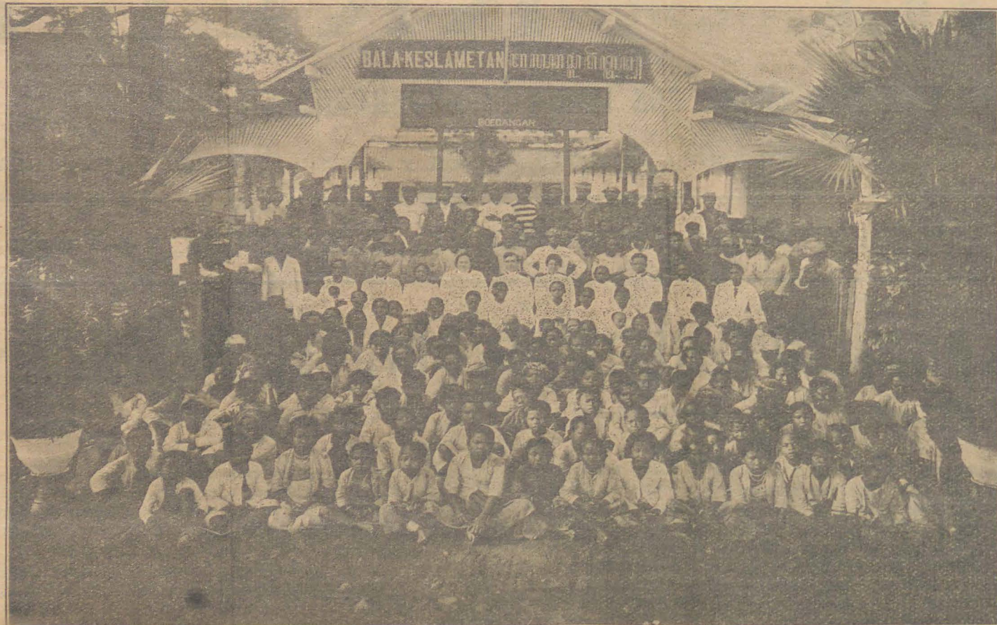
ONZE INRICHTING VOOR ZIEKE EN BEHOEFTIGE INLANDERS TE BOEGANGAN (SEMARANG).