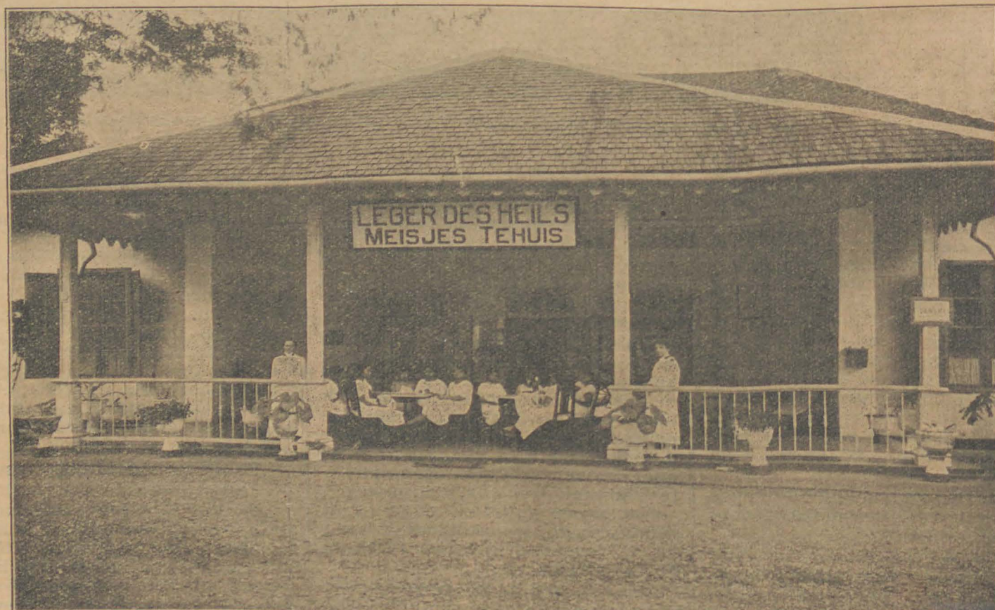
ONS MEISJESTEHUIS OP PONTJOL (SEMARANG.)

Op zekeren avond bracht de Ensigne een bezoek aan een andere Inrichting. Juist toen zij daar vertoefde kwam iemand hulp vragen. Zij zag spoedig, dat dit een geval was voor het Meisjeshuis. Het was al laat in den avond, maar de Ensigne nam haar met zich naar huis, en bracht een bed voor haar in gereedheid. Den volgenden morgen kreeg zij een treurig verhaal te hooren. Nog een jonge vrouw zijnde, had zij haar man verloren en kort daarop haar kindje. Had geen ouders meer en wist niet, wat te beginnen. Haar eenige hoop was het Leger des Heils. Zij vertoefde eenigen tijd in het Tehuis en was zeer dankbaar voor alles, wat voor haar gedaan werd om haar te helpen. Later vond de Ensigne een geschikte betrekking voor haar, waar zij het goed maakt.